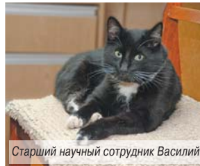
Старший научный сотрудник Василий