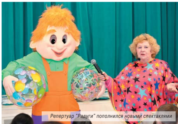
Репертуар "Радуги" пополнился новыми спектаклями

Стоит пояснить, что одна из приоритетных задач проекта «Единой России» «Театры малых городов» – обеспечить равный доступ жителей страны к культурным ценностям и досугу. В целом по России в театрах малых городов в этом году будет показано 414 новых спектаклей. Для большей популяризации театрального искусства будут использоваться интернет и социальные сети. Для этого партпроект запустил свой сайт и канал на YouTube.