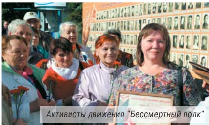
Активисты движения "Бессмертный полк"

1270 имен фронтовиков томилинские участники всероссийской патриотической акции «Бессмертный полк» вписали в полковые списки на сайте народной инициативы: moupolk.ru .