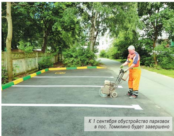
К 1 сентября обустройство парковок в пос. Томилино будет завершено