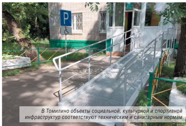
В Томилино объекты социальной, культурной и спортивной инфраструктур соответствуют техническим и санитарным нормам

Он отметил, что далеко не все предприятия бытового обслуживания отвечают требованиям доступности для маломобильных групп, но с их руководством достигнуто понимание, и оно в кратчайшие сроки недостатки постарается устранить. Глава подчеркнул, что в будущем для мониторинга объектов будут привлекаться и представители Люберецкой общественной палаты.