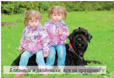
Близнецы и двойняшки, все на праздник!

6 августа в 11:00 в Парке культуры и отдыха «Наташинские пруды» городского округа Люберцы пройдет праздник близнецов «Счастье вдвойне» .