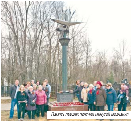
Память павших почтили минутой молчания

В поселке Томилино, у памятника Неизвестному Солдату на Токаревском кладбище, активисты движения «Бессмертный полк» и ветераны провели патриотическую акцию «Вошедшим в память неизвестными».