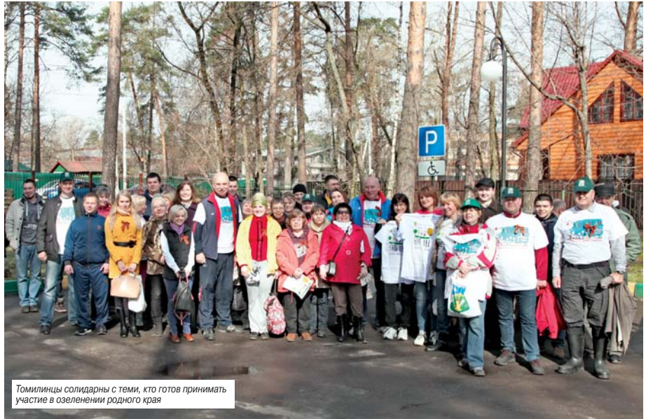
Томилищцы солидарны с теми, кто готов принимать участие в озеленении родного края

Кроме лесопосадок на главной площадке акции «Лес Победы» – в пос. Мирный – активные томилищцы развернули работу и непосредственно в поселке.