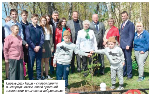
Сирень дяди Паши – символ памяти о не вернувшихся с полей сражений томилинских ополченцах-добровольцев

Ирина РОГОЗИНА Фото из семейного архива Тузовых и Андрея ПОПКОВА