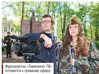
Журналисты «Томилино-ТВ» готовятся к прямому эфиру

Прямой эфир на местном телевидении в День Победы начнется в 18:00 и завершится залпами салюта Победы в 22:00. Трансляция в реальном времени будет вестись на сайте www.tomilino.tv .