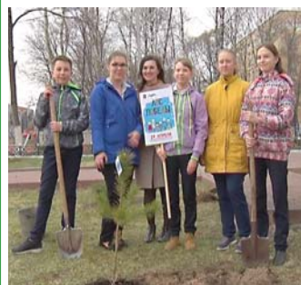
Учащиеся и педагоги школы № 19 озеленили территорию мемориального комплекса

Активными участниками патриотической акции «Лес Победы» стали учащиеся и педагоги школы № 19. Сосны и ели, которые учебному заведению были переданы из Управления образованием городского округа Люберцы, старшеклассники высадили около мемориального комплекса, посвященного не вернувшимся с войны труженикам Томилинской птицефабрики, а также на прилегающей к памятнику территории.