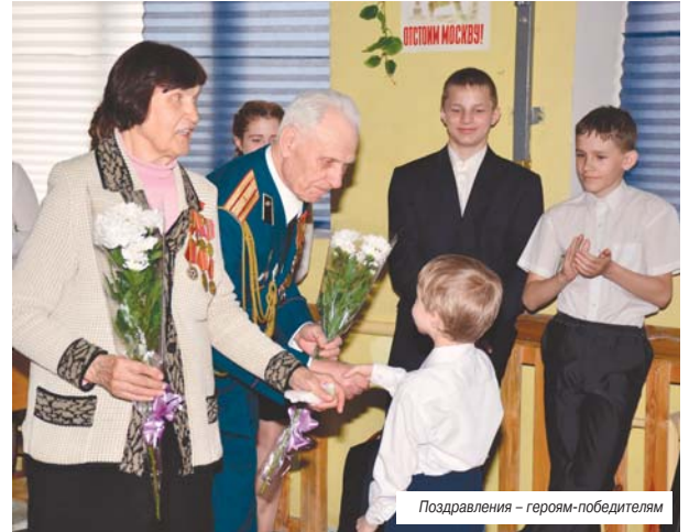
Поздравления – героям-победителям

Учащиеся и педагоги школы № 17 к 72-ой годовщине со дня Великой Победы подготовили литературно-музыкальную постановку «Слово о солдатской матери». Ее зрителями стали ветераны войны, труженники тыла и представители общественности городского округа Люберцы.