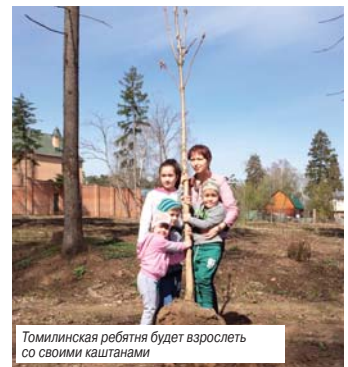
Томилищские ребята будут взрослеть со своими каштанами

По мнению педагогов, акция «Лес Победы» – мероприятие очень важное для патриотического воспитания учащихся. Мальчишки и девчонки не только озеленят родной поселок, но и делятся семейными легендами о вкладе своих предков в дело Великой Победы. Потому каждая сосна и каждая ель, на которых они укрепляют бирочки с логотипом акции «Лес Победы», будет служить напоминанием всем жителям микрорайона о том, что высажены деревья благодарными потоками в честь победителей-дедов.