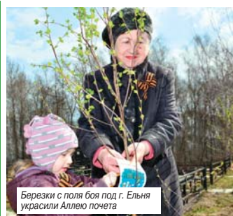
Березки с поля боя под г. Ельня украсили Аллею почета