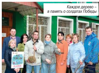
Каждое дерево – в память о солдатах Победы

Березки – символы России, в то время как сирень с мая 1945 года служит символом главного праздника нашей страны – дня Великой Победы. Потому они и появились на улице Гоголя.